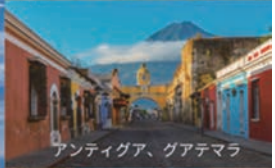
アンティグア、グアテマラ