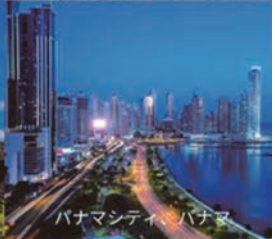
パナマシティ、パナマ