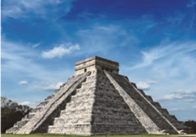
マヤ文明、メキシコ