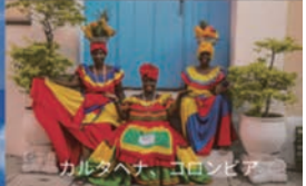
カルタヘナ、コロンビア