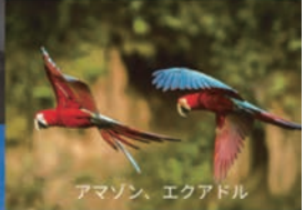
アマゾン、エクアドル