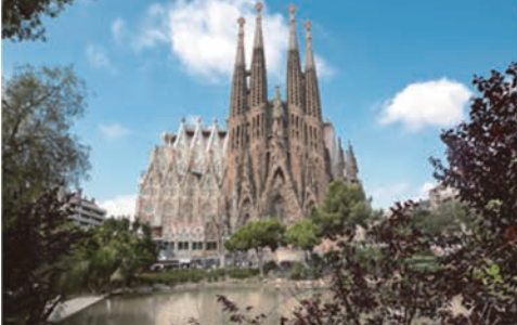
サグラダ・ファミリア