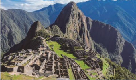
マチュピチュ遺跡、ペルー