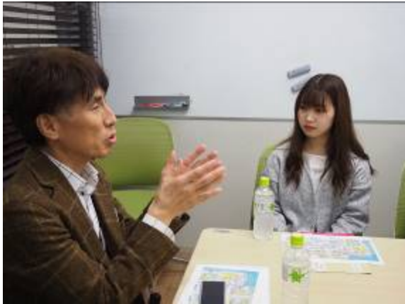
小西氏による説明