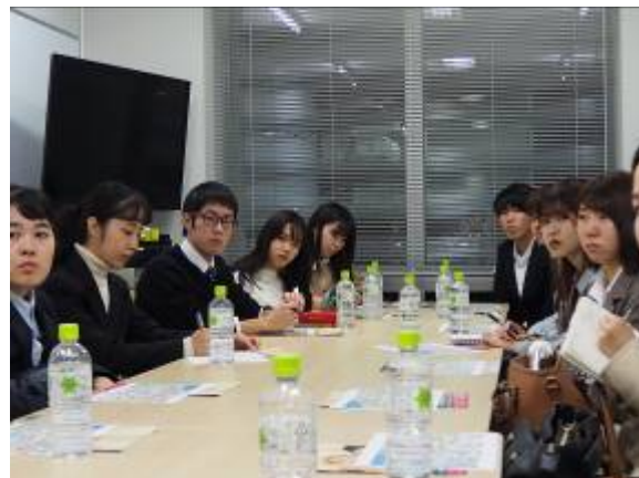
真剣に耳を傾ける学生