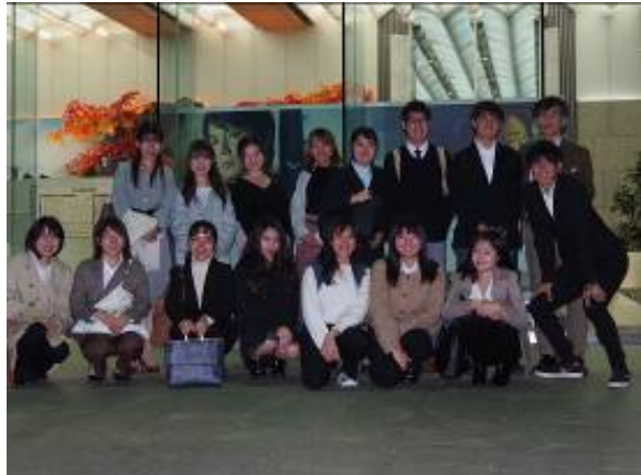
参加学生の集合写真