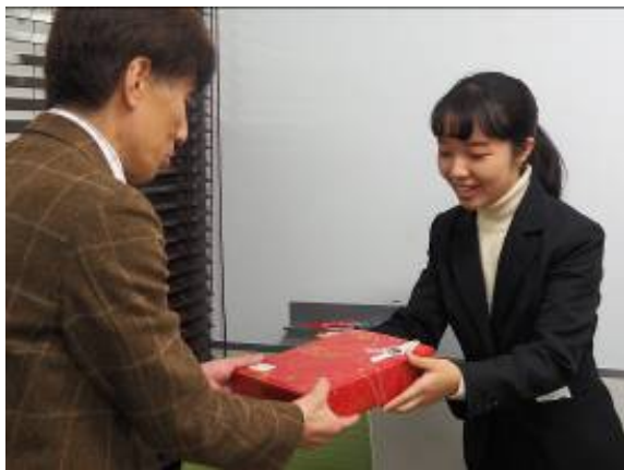
学生代表による手土産の進呈