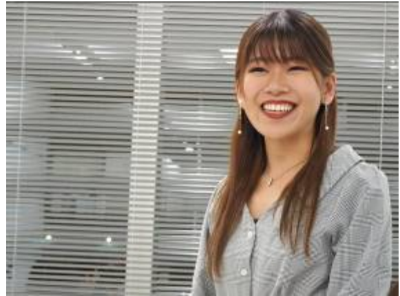
学生代表による挨拶