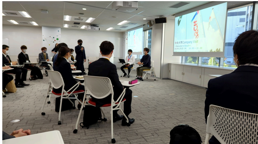
一年生参加学生による開式の挨拶

質疑応答の時間の後には社内を見学させていただくという学生ではなかなか得られ難い経験をさせていただいた。本訪問でお世話になった担当の方々、実りのある時間をありがとうございました。