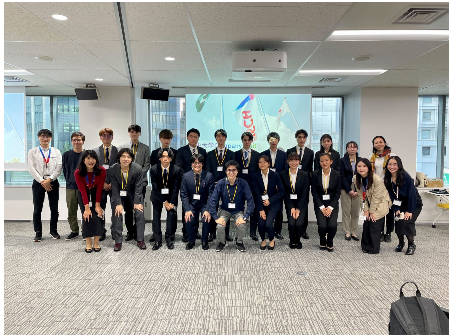
BOSCH の社員の方々、インターン生の方々、国際経営学部生での集合写真