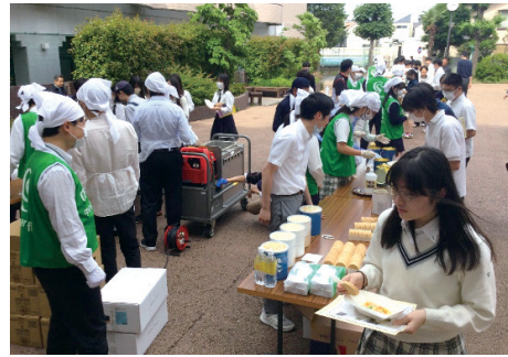
中庭で温かいシチューが配られました

生徒からは「災害時に温かい物が食べられるなんて、贅沢ですね!」などと感想が寄せられました。