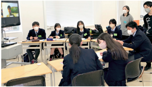
オンラインを交えた「実践」講座風景