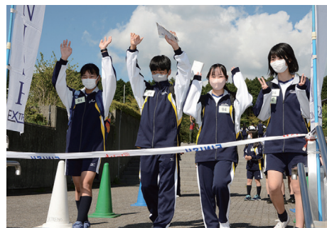
ぶちアドベンチャーをゴールするところ

初めは知り合いの少なかった生徒たちが、この合宿を通じて絆を深めた姿が見られました。生徒たちには今後の高校生活でさらに絆を強くし、困難を乗り越えながら素晴らしい時間を過ごしてほしいと願っています。