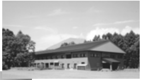
野尻湖セミナー ハウス外観