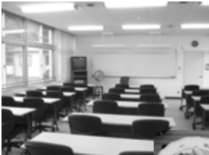
富浦臨海寮 ゼミ室

富浦臨海寮は、東京電力の計画停電実施の可能性に伴い、現在開室日を検討中です。詳細については、学生課へお問い合わせください。