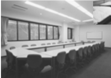
野尻湖セミナーハウスゼミ室A