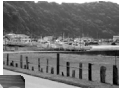
富浦臨海寮 付近の海辺