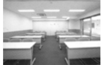
さくら館セミナー室