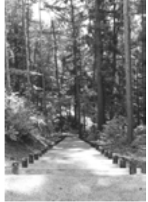
野尻湖セミナーハウス木道