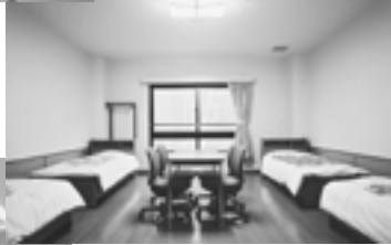
野尻湖 セミナーハウス洋室