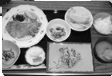
富浦臨海寮夕食一例