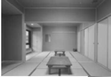
野尻湖 セミナーハウス和室