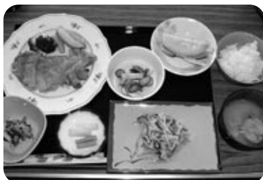
富浦臨海寮夕食一例