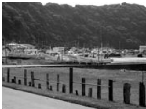
富浦臨海寮 目の前の海辺