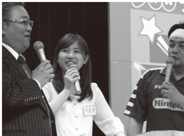
サンドウィッチマンとともに司会を務める中島さん