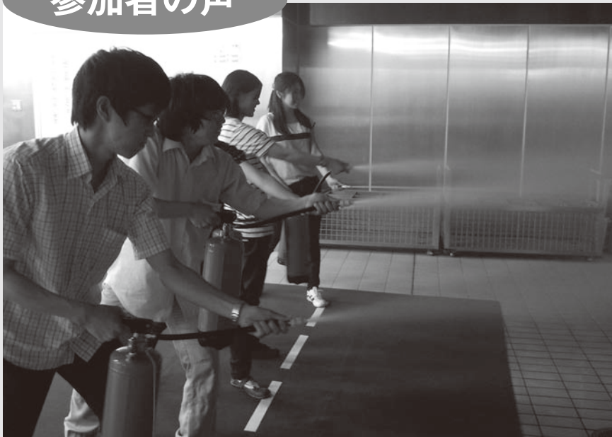
消火器を使った消火活動