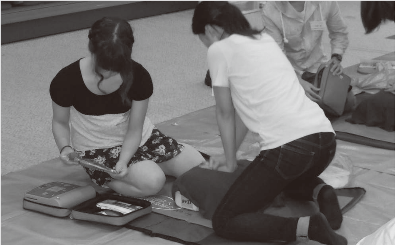
講習会は実技を中心に行います