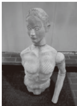
オーバースペック