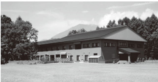
野尻湖セミナーハウス外観