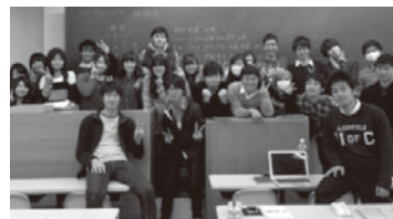
今年のめでるくんプロジェクトメンバー

スタンプラリー開催!! (スタート地点・ラリーマップ配付は第1体育館前テントです)