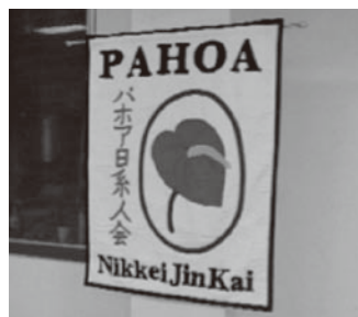
ポスターには、パホア日系人会と明記されていました

今までは怖さと信じたくない気持ちから、高校時代にあった沖縄研修でも、目をつぶってしまう自分がいました。あれから少し成長できたかなと思うことがあります。ハワイで戦争を身