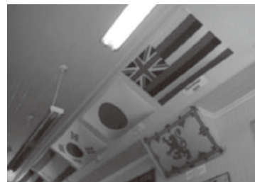
博物館には、ハワイ州旗の隣に日の丸が掲げられていました