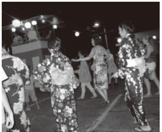
私たちが参加したパホアでの盆ダンス。集会所の読経から始まりました