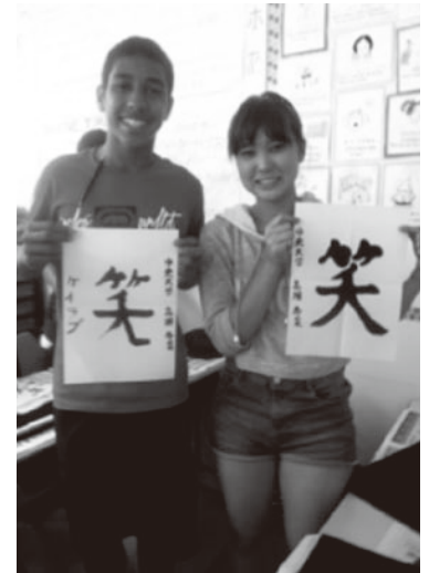
次は私の好きな文字を紹介しました「笑」と書きました

ハワイの日系人・日系社会は、日本文化の継承を積極的に行っていました。見聞した「盆ダンス」(盆踊り)、