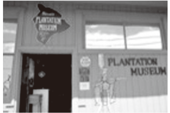
プランテーション・ミュージアムは、日本からの移民が働いた農園の博物館

訪れた日本人墓地では、ハワイでこんなにも多くの方が亡くなったのか…と驚きました。「日本人」「日系」であるがゆえに虐げられ、戦争に翻弄された人も多かったようで