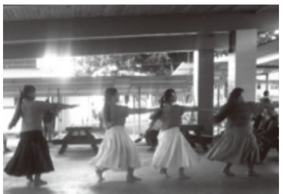
ヒロ高校フラダンスチーム。コンテスト受賞実績があるという実力派

す。「我慢、頑張る、おかげさまで」という日本人ならではの強い気持ちを持ち、異国の土地で粘り強く闘った人たちには頭が下がります。合掌。