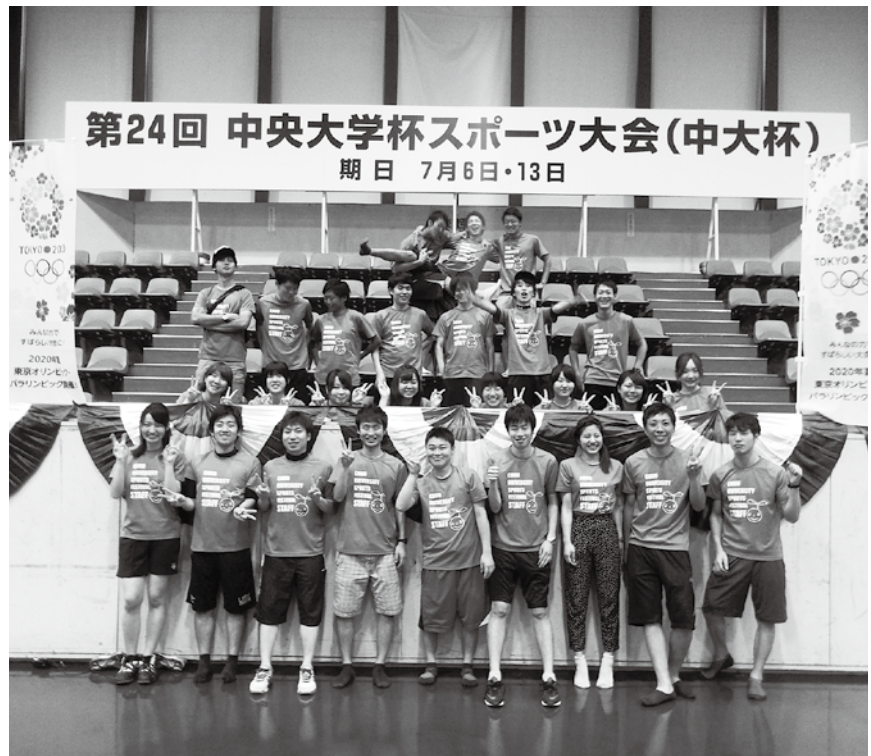
2014年度「めでるくんプロジェクト」メンバー集合写真

単に「お楽しみ」企画ではなく、学びの場となっております。皆様のご参加をお待ちしております。