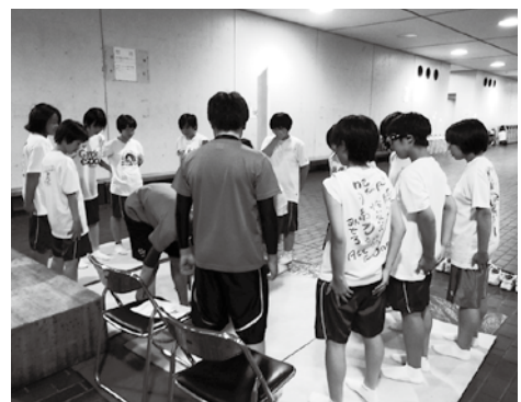
身体の特徴を知る「4スタンス理論」のコーナー