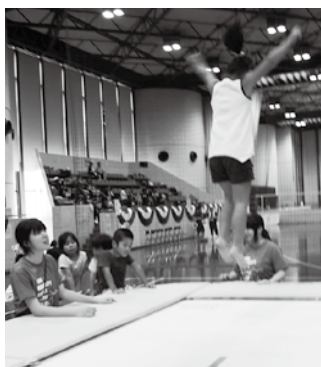
トランポリン経験教室