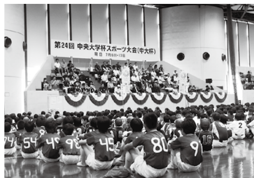
大会開会式の様子