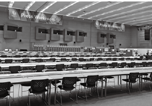
メインプレスセンターのワークルーム

まだまだ撮影を続けたかったが、授業や旅費の問題で、翌日便で帰国しなければならない。後ろ髪を引か