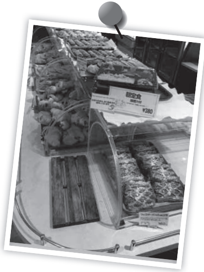
「フラット」に並ぶパン