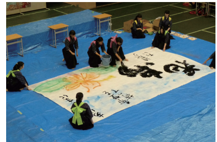
毎年恒例の書道パフォーマンス。大筆を使ったパフォーマンスはまさに圧巻！

今年は9月12・13日の2日間で体育祭を実施しました。1日目は後楽園キャンパス理工学部アリーナを会場として、各学年種目や騎馬戦の予選を行い、2日目は会場を多摩キャンパス第一体育館に移しての本戦。体育祭の2日目の見せ場は応援合戦です。各学年の1～3年、A～D組の合同チームが結成され、各チームが応援団旗を振りかざし、オリジナリティあふれる衣装に身をまとい応援をしました。プログラム終盤の騎馬戦、綱引き、選抜リレーになると、盛り上がりも最高潮に達し、白熱した1日となりました。