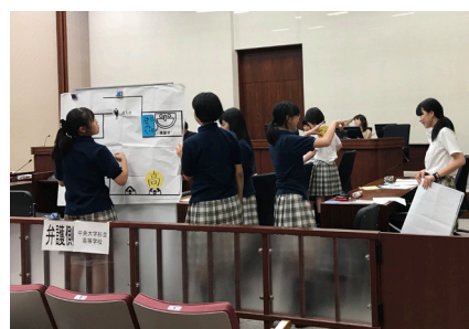
大法廷で発揮したチームワークが大いに評価されました。