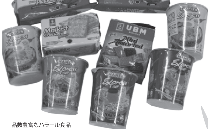
品数豊富なハラル食品

でもご購入いただけます。国際理解の観点から、一度、お試しになりませんか」とアピールする。