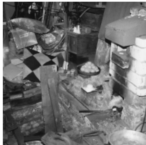
作業場に供えられたミカン

とても專業では食えないので、困ることは錢に追われるということだけで、後は自由だ。こんな自由はなかなか享受できない。なかでも発言の自由は大きいですね。職人社会で、なぜ生きてこられたかという“発言の自由”があったからです。役人