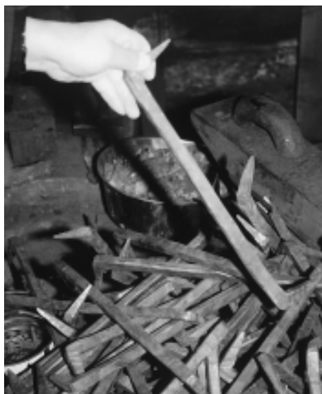
これは岩国の錦帯橋改修に使われた

てあげることが先決だ。腕に職を持つ人間は、どこへ行っても生活できる。とにかく四国に帰って鍛冶屋を再開しなさい」というアドバイスをいただいた。あの方にお会いしなければ私は決断できなかった。終生の課題としての「古代道具の復元」にも取り組めなかったかもしれない。