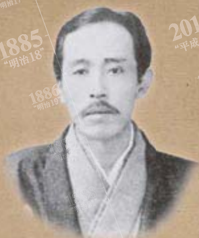
たか はし けん ぞう 高橋健三

1855(安政2)～1898(明治31) / 千葉・曾我野 1870年、高徳藩の貢進生に選ばれ大学南校に入学したが、病氣のため休学。法学を志し、その後東京大学法学部に進学するも78年中退。「学業は実力さえあれば卒業しなくても同じ事」と全く意に介さなかった。翌年、駅逓局を皮切りに文部省などの書記官を務め、89年帝国憲法発布直後、内閣官報局長に就任。自恃と号した高橋は、この時官報号外に掲載された帝国憲法の前文中に1字誤りがあったことの責任の所在をめぐって、憲法制定の立役者で当時枢密院議長であった伊藤博文と激しく対立。一歩も引くことのなかった高橋に対する伊藤の評価はかえって高まり、英吉利法律学校に「英文帝国憲法義解」の版權が与えられたといわれている。また官報局長でありながら、政府の民法典を批判、その実施延期運動では中心的存在であった。英吉利法律学校では、商船法などを講義。