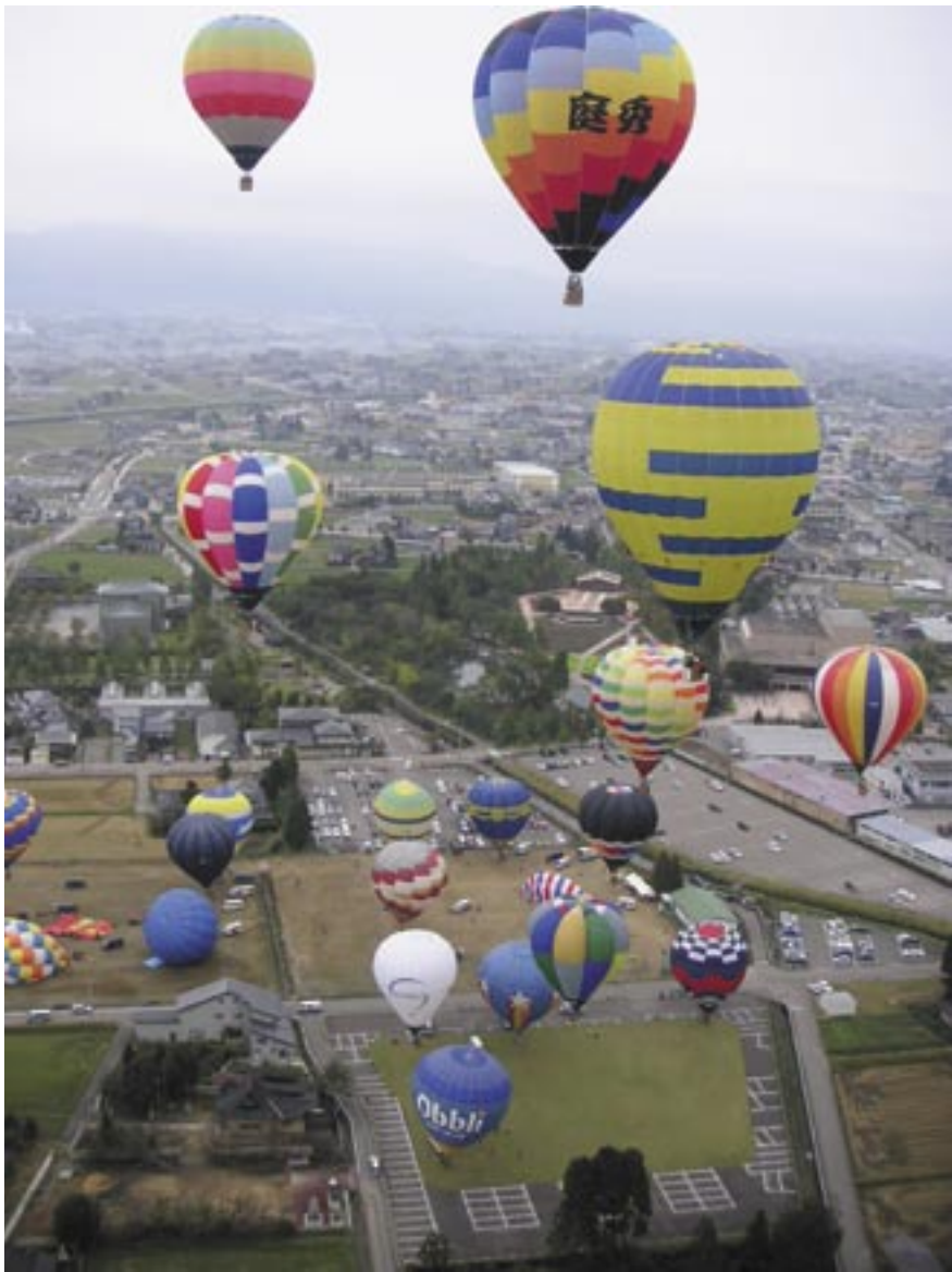
「となみスカイフェス」(05年10月、富山県砺波市) コニカミノルタ DIMAGE VIEWER