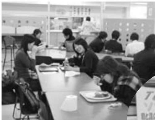
店内はフツーだけど