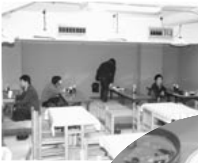
隅の豊席がお好き？

『Chao』はホイ コーローのような もののだが、豚 肉の代わりに魚や 野菜を入れること