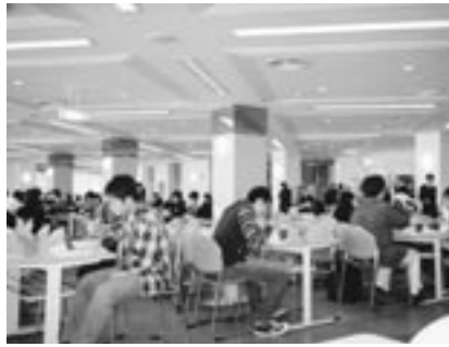
小ぢんまり、フレンドリー