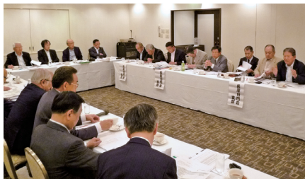
白門ミーティング（近畿ブロック）

学員ネットワークの拡充・強化として、支部のホームページ作成・支援や「記念誌」発行に対する支援、白門ミーティングや海外支部長会議の開催などがあります。このうち白門ミーティングについては、6月13日（土）に近畿ブロック（会場・大阪白門サロン）にて開催しました。今後は北海道や東北ブロック、中国・四国ブロックでの開催も予定しています。