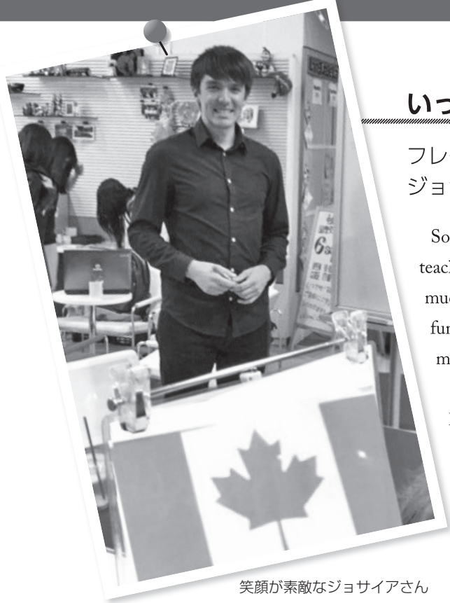
笑顔が素敵なジョサイアさん