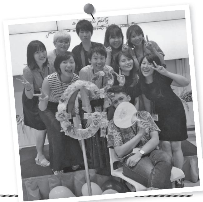
笑顔で迎えるGスクエアのスタッフ