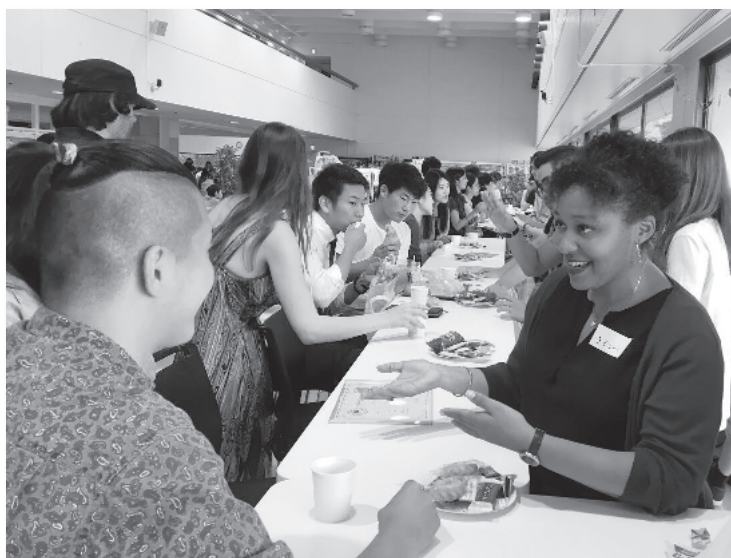
楽しいグローバルカフェ

Language Lab は、留学生による言語講座です。英語や中国語、スペイン語など学期によって様々な講座が開かれています。外国語だけではなく、その国・地域の文化や慣習などについて学べます。