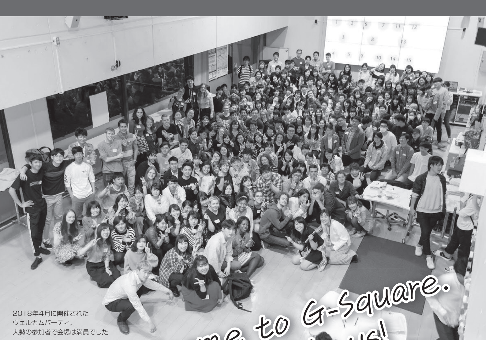
2018年4月に開催された ウェルカムパーティ、 大勢の参加者で会場は満員でした