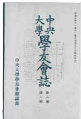
『中央大学学員会誌』創刊号(大正9年)

時は流れて今回の東日本大震災。学生たちの限りないエネルギーは、いまも本学の支えとなっています。