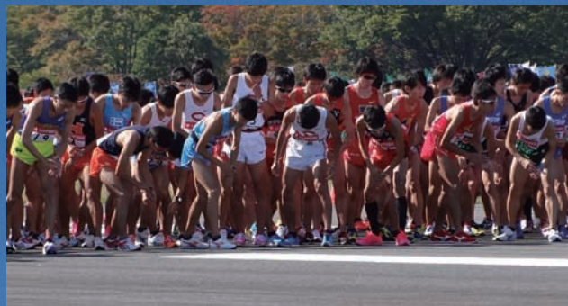
スタート直前。48校561名が一斉に駆け出す。

箱根駅伝最多出場・最多優勝を誇る我が中央大学。長年、シード権を確保していたため、立川で行われる予選会には出場経験が浅い。不慣れな状況のなか、応援する多くの学员、関係者も早朝から詰めかけ、声援を送った。