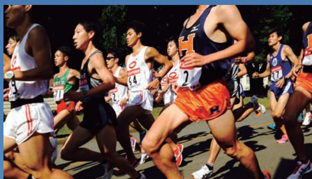
スタート後、選手たちは立川駐屯地滑走路を5キロ周回し、その後、立川市街へ。