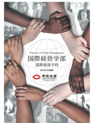
国際経営学部パンフレット