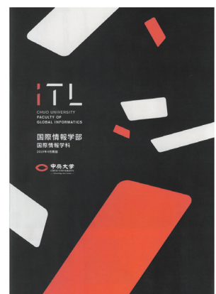
国際情報学部パンフレット