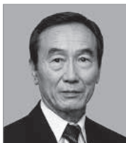
中條 誠一 教授