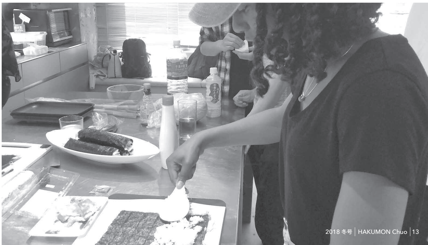
手巻きすしづくりにチャレンジ

I recommend to everybody to go through Shiroikaze circle club. You will never regret it.