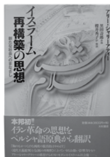
イスラーム社会学者A. シャリーアティーの『イスラーム学』をペルシャ語から翻訳。この本はイラン革命の中心思想の一つとなった。

ラーム法が不労所得である利子を禁じているからです。日本でもこのようなイスラーム金融への関心が高まっており、経済や金融の専門家が積極的に研究を進めています。その多くは、無利子金融の技術論にとどまっている印象があります。イスラーム金融の基盤にある経済システムの独自性についての理解ははまだ