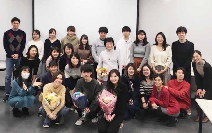
毎年1月、卒業生もかけつけて4年生の卒論報告会を開催しています。

や紛争、貧困などをテーマとした文献を通読することにより社会科学面での知識を養っていく。そして学生それぞれが関心を抱いたテーマを選び、本格的な研究に入る。