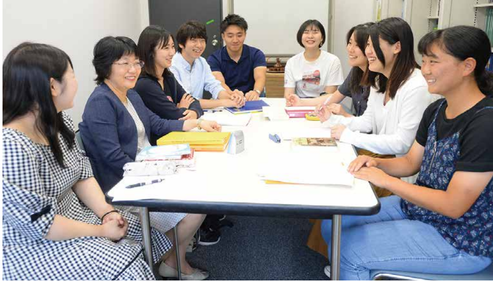
櫻井ゼミでは、活発なディスカッションが行われます。