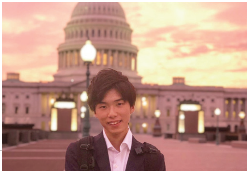
1年次に短期留学したワシントンD.C.にて

私は、将来ビジネスを通して世界中 の人々の役に立てるようなことを成し 遂げたいと考えています。