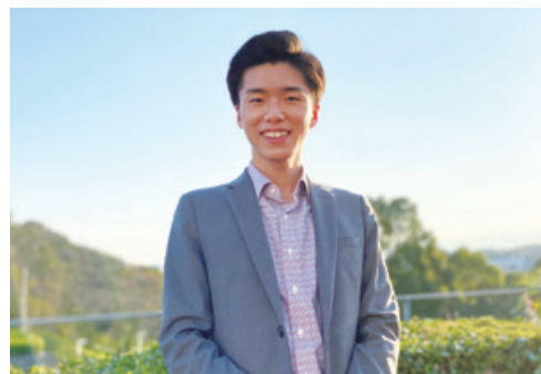
海外での活躍をめざす筆者

中央大学国際経営学部に入學し、1 年次の夏に学部カリキュラムの一環と して参加したワシントンD.C.への 短期留学では、世界を舞台に活躍され