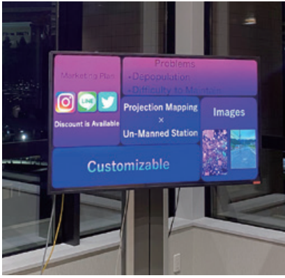
オンラインプレゼンテーションの準備風景

私を含め集まった仲間は6人。「日本酒の市場規模拡大」をテーマに、それぞれのアイデアを持ち寄り、毎晩のようにオンラインミーティングを行いました。これまで、自分自身が主体となり、チームで一つのことに打ち込むという経験がなかった私にとって、それぞれの考え方や価値観の違いなどには戸惑う場面が多々ありました。しかし、留学中はもちろん、社会に出たら幾度となく直面するであろうこうした衝突を肌で感じ、自分自身の課題にも気づかせてくれたこの経験は、何ごとにも代え難いものであったと考えております。国際経営学部では、チームマネジメントや人的資源論などについて学びますが、そうした学びを実践的に