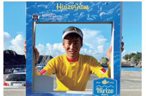
ライフセービングで留学を果たした筆者

ほかにも、監視活動では共同生活をするようになるので、人間力を培うことができると、好奇心旺盛な私にとつては、あまりにも魅力が詰まっている活動だと感じました。そして気づ