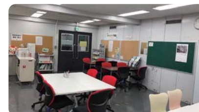
ボランティアセンター内

ティアセンターの掲示板や募集情報をまとめたファイルから、興味のある活動を探すことができます。 ボランティアセンター主催プログラムについては、センターへ申し込みますが、それ以外の応募は各自でボランティア募集団体へ連絡を取り、申し込みます。