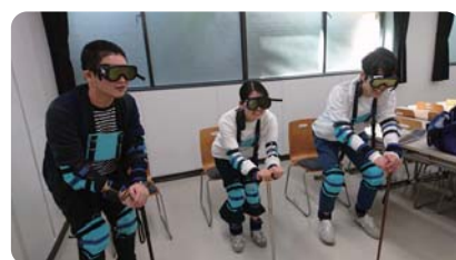
ユニバーサル・スポーツ体験会