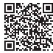
メールマガジン登録

ボランティアセンターには専門のコーディネーターがいます。ボランティア情報の提供をはじめ、ボランティアの心得や活動に対する不安など何でも相談に応じます。少しでもボランティア活動に興味がありましたらぜひお気軽にお越しください。