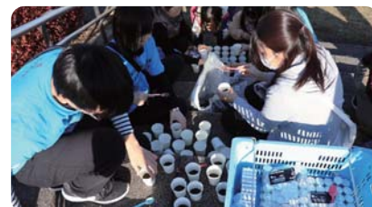
大栗川キャンドルリバー