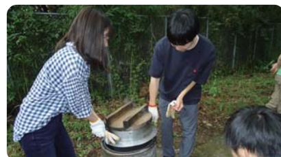
落川交流センター