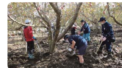
丸森町での災害ボランティア