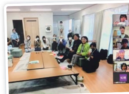
現地の方とのオンライン交流会

現地では、主に真備の四つの仮設住宅にて、戸別訪問とイベント企画を通じたコミュニティ支援活動を行っています。戸別訪問では、住民の方の現状を把握するとともに、困っていることや心配事を話してもらうことで少しでも不安を和らげることが出来るように努めています。イベント企画では、真備にちなんだものや季節に合ったイベントを集会所にて開催し、住民の方同士を結び付けたり、集会所利用の活性化を促すことが出来るように努めています。2020年度はコロナウイルスの影響で現地活動が出来ない中、オンライン交流会やお手紙などを通して住民の方々と交流しました。