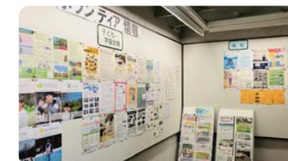
ボランティアセンター掲示板