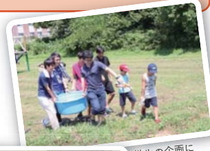
学生の企画に子どもは大喜び