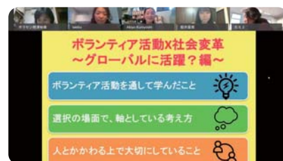
ボランティア経験 × 社会変革講座 (オンライン)