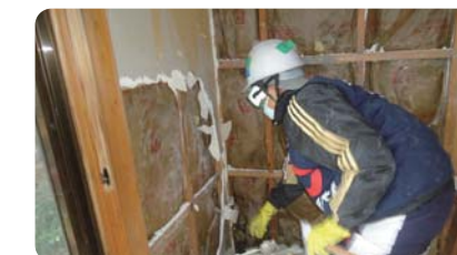
長野市での災害ボランティア