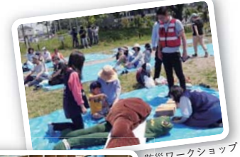
防災ワークショップカエルキャラバンの様子