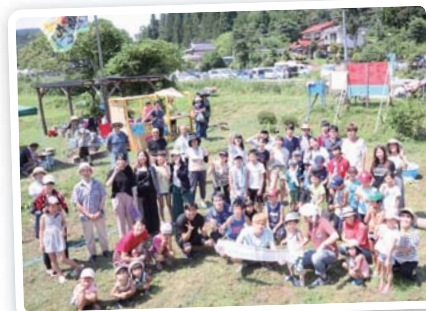
ふれあい農園では子どもがたくさん！

私たちは宮城県気仙沼市面瀬地区の小学生と中高生を対象に、宿題指導と自由遊び、企画を中心として活動しています。長期休暇中に約1週間現地に滞在し、活動ごとに、活動場所の自治会館が賑わうほど多くの子ども達が来てくれます。また、週に1回程度、私たちのひらく場が子ども達みんなにとって過ごしやすくなるよう、メンバー全員でミーティングを重ねています。小学校の先生、現地NPO等地域の方にご協力やアドバイスをいただきながら、子ども達と地域の様子、その変化に合わせて、子どもの気持ちに寄り添う団体となるように努めています。