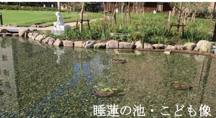
睡蓮の池・こども像

Opened in 1889, Sakamotocho Park was the first community park in Tokyo. It was designed to create open spaces for providing fresh air and healthy environment adjacent to the Sakamoto Elementary School by prefectural landscape architect Yasuhei Nagaoka.