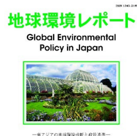
No. 14 March 2011 ■■ 地球環境レポート編集委員会 発行 中央大学出版部