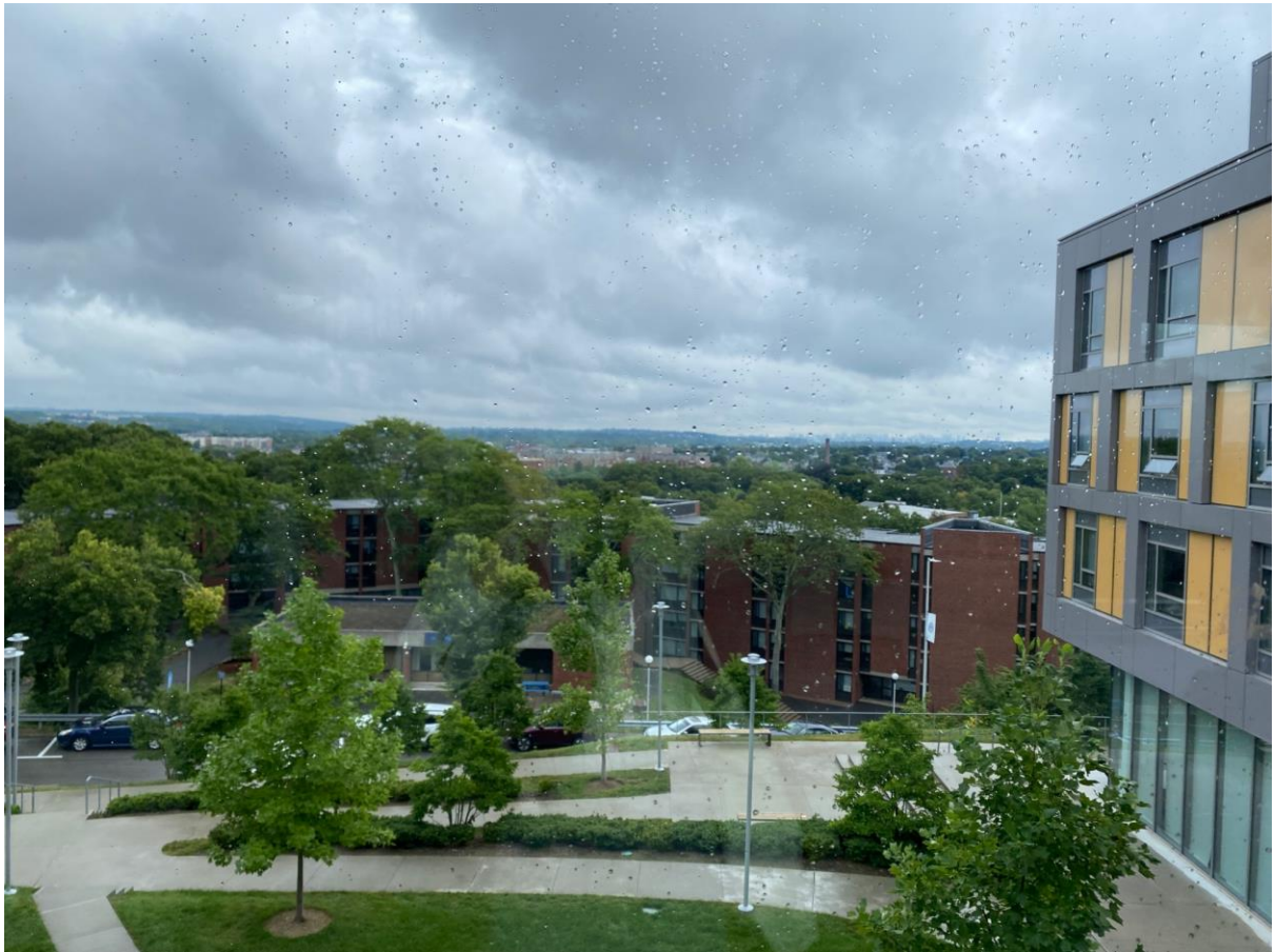
↑ SKY LINE から一望できるキャンパス