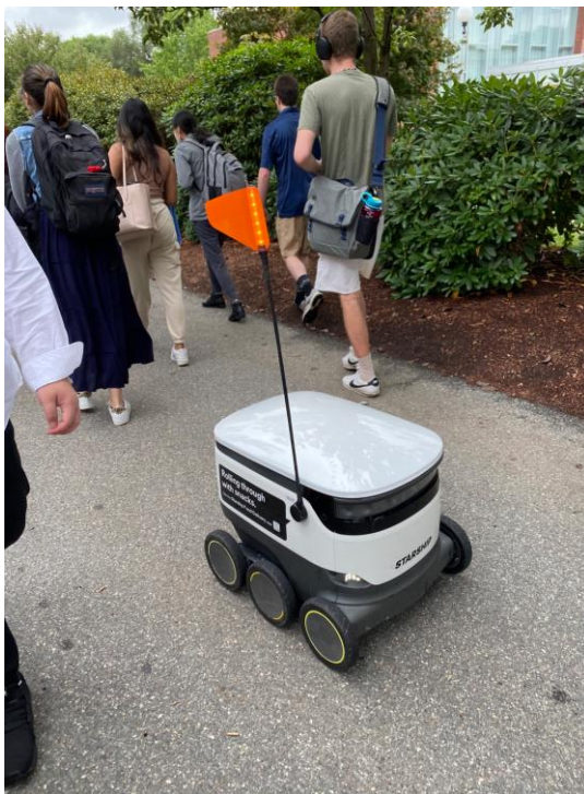
↑食事を運ぶロボットがキャンパス内を移動している様子