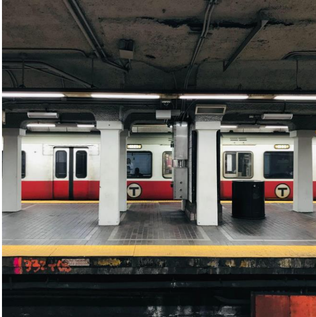
red line、Park St 駅にて

Harvard 駅についてからは、駅からすぐ近くの Harvard coop（大学生協）で買い物をしました。個人的には、Harvard のスクールカラー、あずき色の T シャツを買ってこいと言われていたので、あずき色 T シャツ探しに奮闘していました。。。海外大学のアパレルのデザインの可愛さと、豊富さから、大学のブランド力の凄みを感じました。