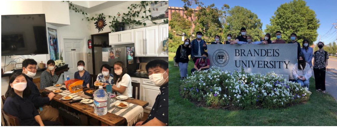
Boston に到着して Airbnb で初めての食事🍴