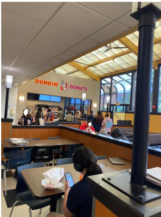
↑ 食堂内にある DUKKIN DOUNUTS