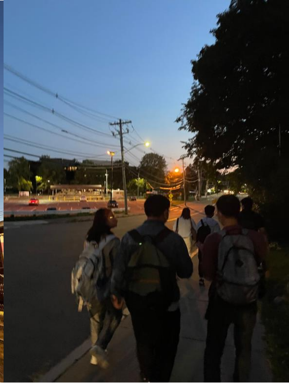
ブランダイス大学から駅に向かう様子