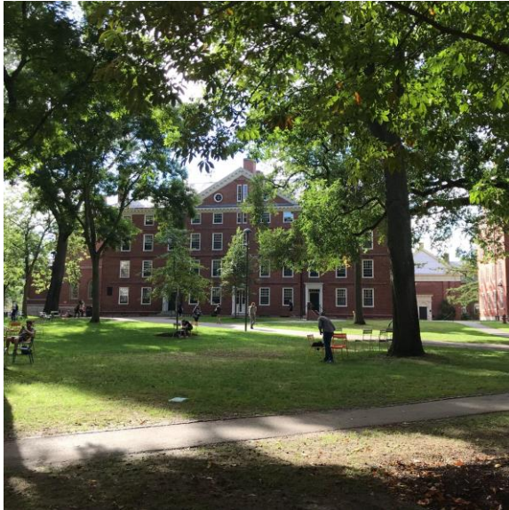
☞ キャンパス内の広場の様子 カラフルなイスが置かれていて、なんとも情緒的

キャンパスツアーの出発前に近くのカフェで待機していたのですが、そのカフェのテーブルには、直接、チェス盤がデザインされていました。これもただのデザインではなく、実際にチェスをしている2人組もいて、試合をのぞき込む人、気にせずコーヒーを楽しむ人、おしゃべりする人など、カフェにいる人たちからも、ケンブリッジの人々の日常が垣間見れたような感じがします。