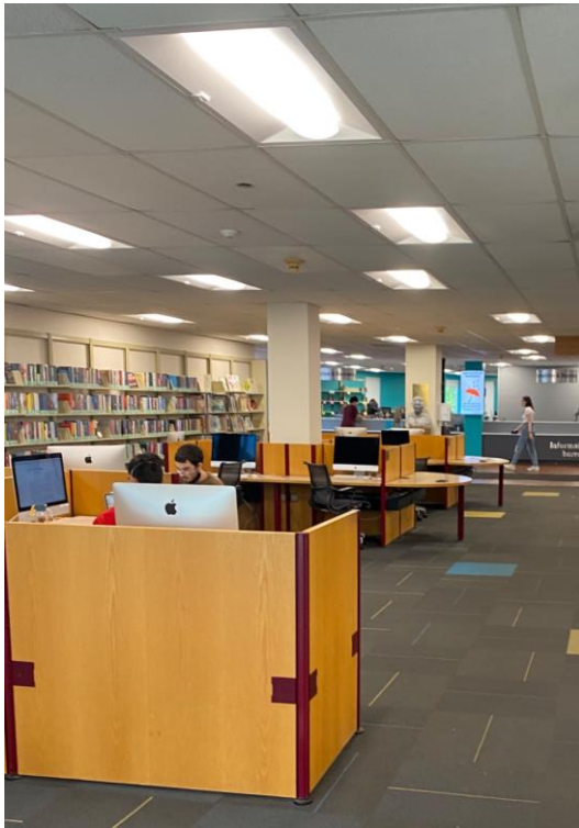
↑ 図書館内部の様子