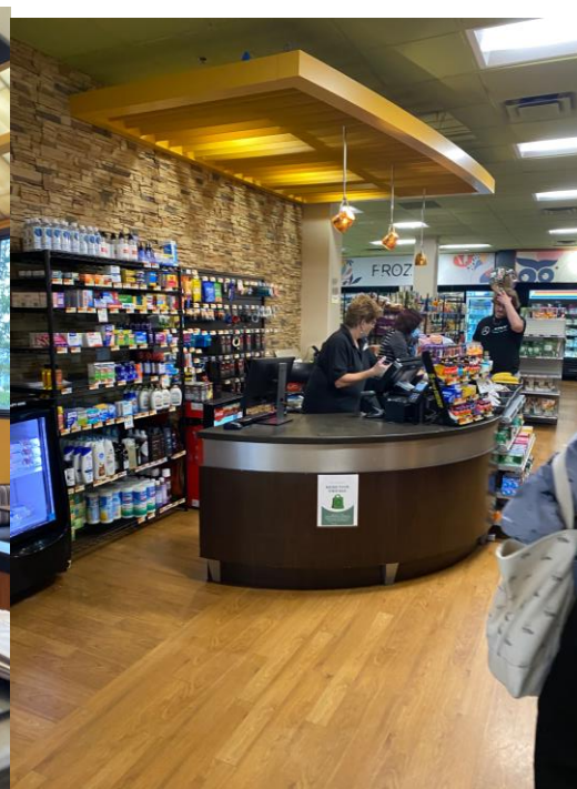
↑ 食堂に併設しているコンビニ