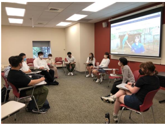
興味のある SDGs を発表する様子