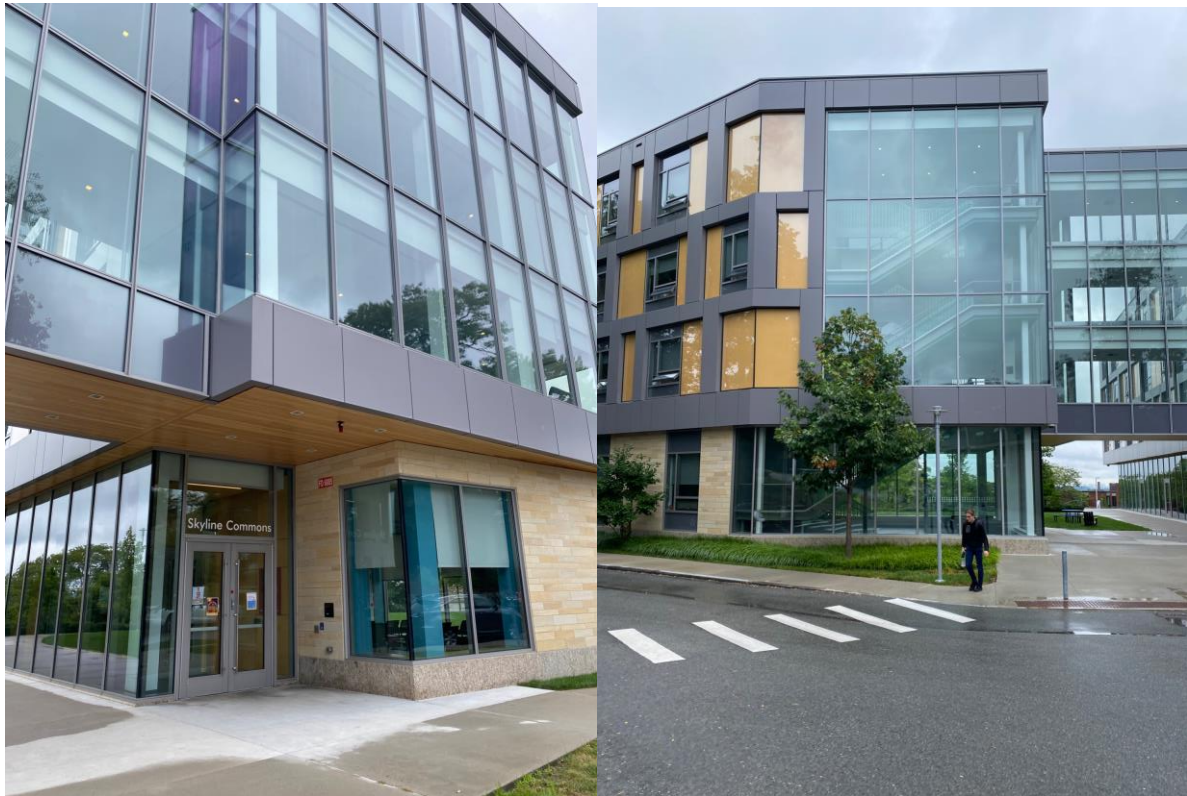
↑ 大学内で最も綺麗な寮 SKY LINE