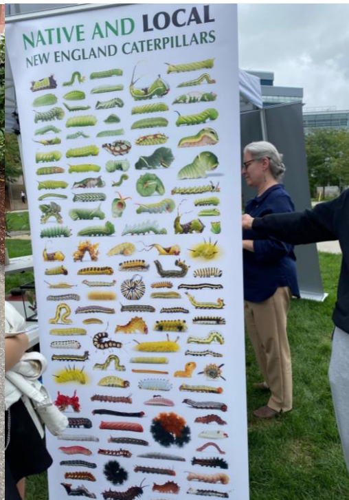
↑キャンパス内で開催されていた虫を展示するイベント