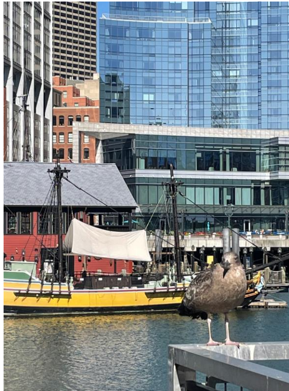
ボストン茶会事件現場とかもめ