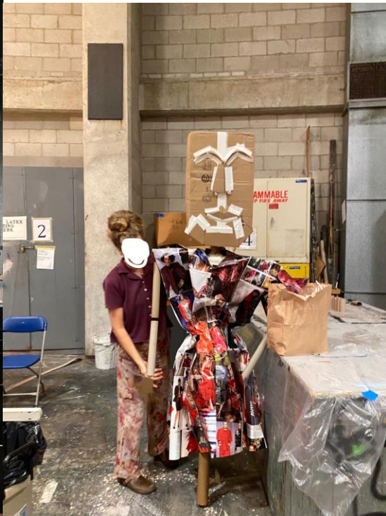
↑劇場を案内してくれた先生とリサイクル品でできた人形