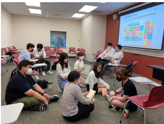
ペア決めに向け自由に議論する様子