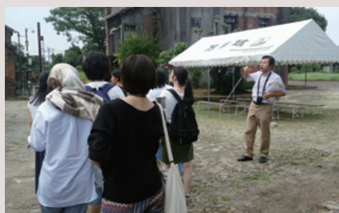
2017年夏期フィールドワークでは炭塵爆発の現場や被害者家族を訪ねた