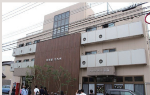
2017年夏期フィールドワークで訪問した抱樸館 北九州

と同時に、社会学とは、「自分の根っこを自覚する学問」でもあります。身の回りの現実を深く観察し、その歴史をたどることは、自分の根っこ（ルーツ）を確認することにもつながるでしょう。私にとって、学問とは、「自分の言葉を獲得するもの」。社会学という「新しい言葉」を持つことで、現代の諸課題と真剣に向き合い、新たに社会を構想・想像できるようになってほしいと願っています。