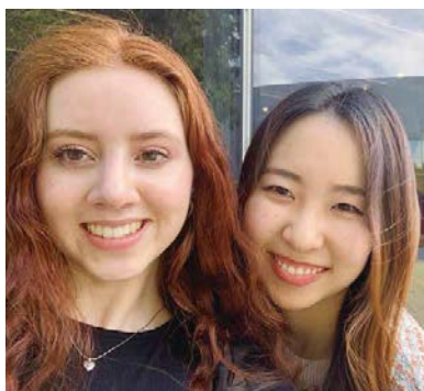
Global Studies Iのスピーキングパートナーと