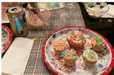
友人宅にてカップケーキのデコレーション

ンパスで、現地学生による留学生サポートのコミュニケーションも充実しており、留学生を歓迎してくれる温かい人にたくさん出会えました。 私はE.T.S.U.でマネジメントを専攻しながら、国際関係について学んでいました。国際経営学部では200人程にもなる大人数クラスもありますが、E.T.S.U.の授業形態は30人前後の少人数のクラスが多く、生徒の発言も活発で先生との距離がより近く感じられました。試験回数、課題の量とにとっても多く、授業前後と夕食後は毎日図書館で勉強していました。その中で実感したことは、今まで国際経営学部で学び、経験してきたことの価値です。特に前述した2点は、留学初期から大きなアドバンテージになっていました。英語での授業・課題が国際経営学部では当たり前だったことで、大きなギャップを感じることもなくE.T.S.U.での生活にもすぐに適応することができました。 また、特に思い出深く貴重な学びだと感じたのは、Peace, Security, and Human