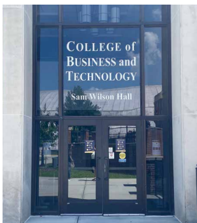
ETSU マネジメントの学部棟