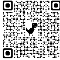
春募集申込フォーム

春募集 : https://forms.gle/w9zpUF2oyarEdiyt7