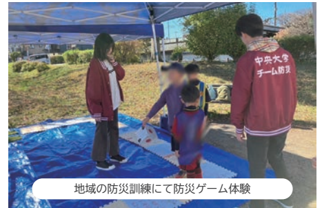
地域の防災訓練にて防災ゲーム体験