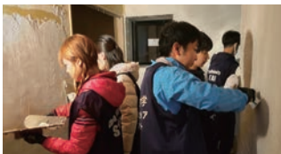
秋田県五城目町での災害ボランティア