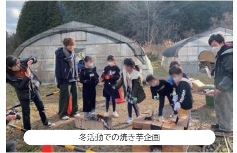
冬活動での焼き芋企画