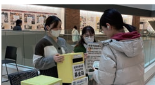
能登半島地震支援 構内募金活動