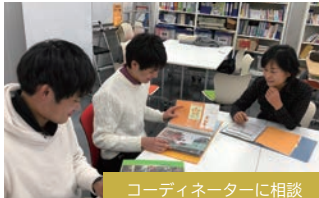
コーディネーターに相談