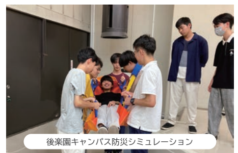
後楽園キャンパス防災シミュレーション