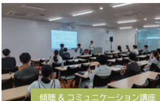
傾聴 & コミュニケーション講座