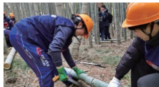
宮城県丸森町での災害ボランティア