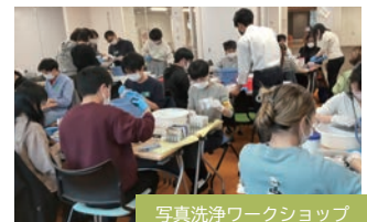
写真洗浄ワークショップ