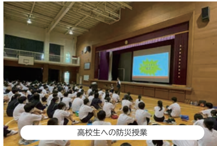
高校生への防災授業