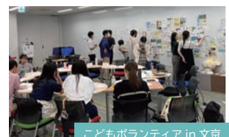
こどもボランティア in 文京