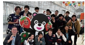
福島県大熊町でのボランティア