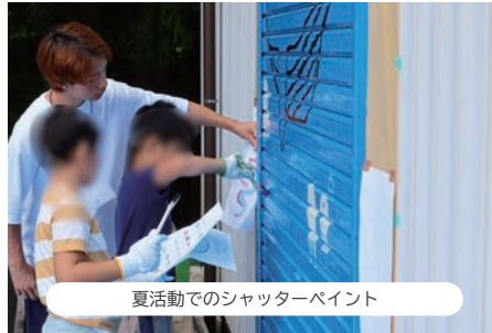
夏活動でのシャッターペイント