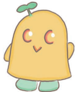
学生スタッフ公式キャラクター んぼらっち〜

学生スタッフは主にボランティアセンターが主催するイベントの運営や企画を担当しています。この団体は、特定のひとつのことではなく、様々なボランティア活動を体験したいという方に最適です。もし興味があれば、ぜひボランティアセンターに足を運んでみてください。