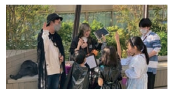
ハロウィンクイズラリーイベント