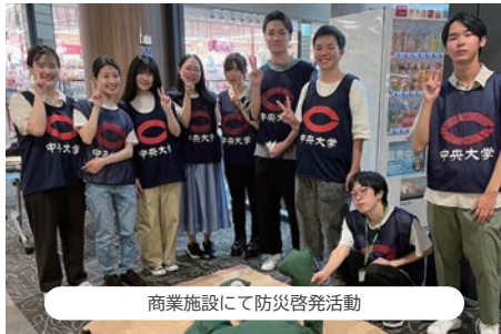
商業施設にて防災啓発活動

E-Mail : teambosai.chuo@gmail.com Twitter : @teambosai