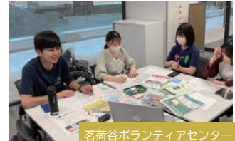
茗荷谷ボランティアセンター