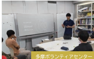
多摩ボランティアセンター