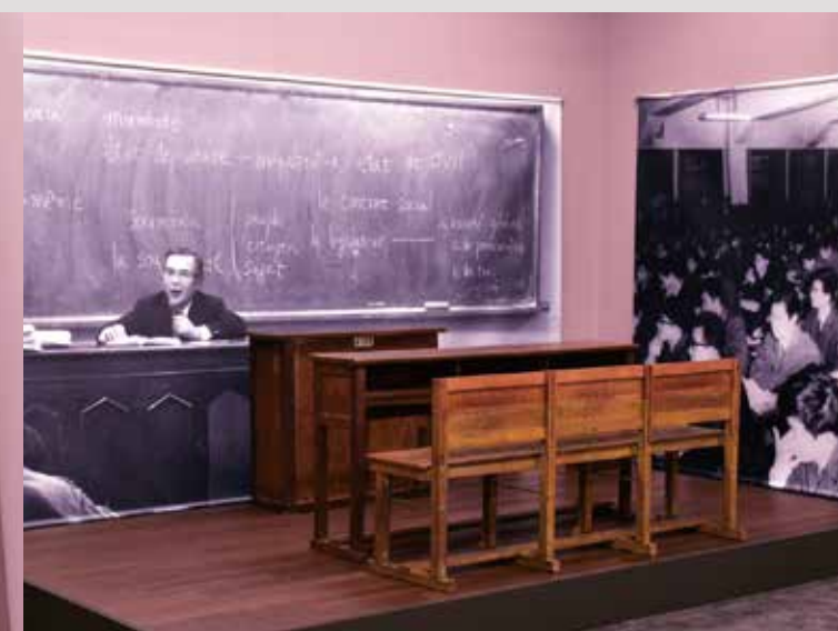
The Museum of Chuo University History