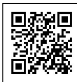
受講料等申込 フォームQR