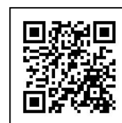
受講料等申込フォームQR

2) 入力したメールアドレス宛に「【中央大学 受講料等 Web 申込・コンビニ決済】ご入金のお願い (コンビニ)」という件名のメールが届きます。内容は、申し込まれた内容とお支払い受付番号などの登録に必要な情報です。記載内容に申込内容と誤りがないか必ずご確認ください。